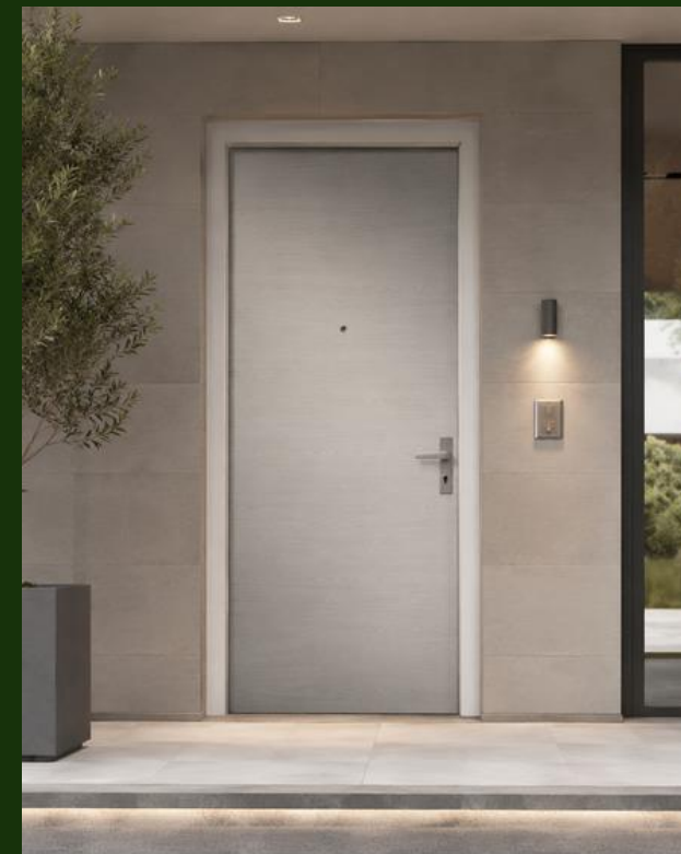
Portoncino di Sicurezza

In legno tamburato laminato, bianche o colori semplici a scelta della DL. Apertura a battente, scorrevole a scomparsa o pivotante, con cerniere e maniglia in alluminio.